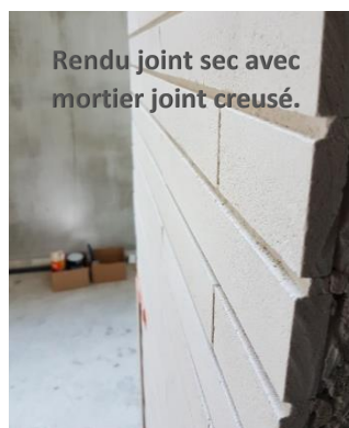
Rendu joint sec avec mortier joint creusé.